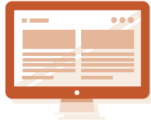
インターネットに 接続されているデバイス