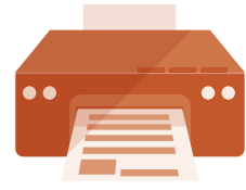
A4サイズが 印刷できるプリンタ

メールアドレスの登録が必要で す。マイページ登録完了、入金完 了、出願完了の確認メールが送 信されます。 ※兄弟が出願する場合、各々の メールアドレスが必要です。